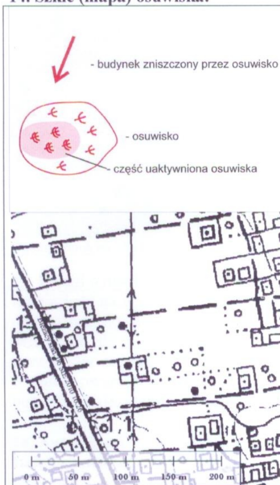
14. Szkic (mapa) osuwiska: