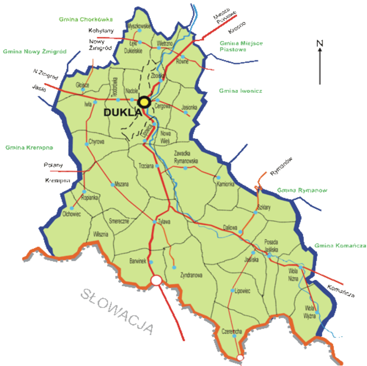
Rys.1 Mapa ukazująca położenie miejscowości Równe na tle Gminy Dukla.

Wieś Równe zajmuje powierzchnię 1392,77 ha. Położona jest w północnej części gminy Dukla. Od północnej strony znajduje się Rogowska Góra, a od południowej strony Pachanowa Góra. W latach 1975-1998 miejscowość położona była w województwie krośnieńskim.