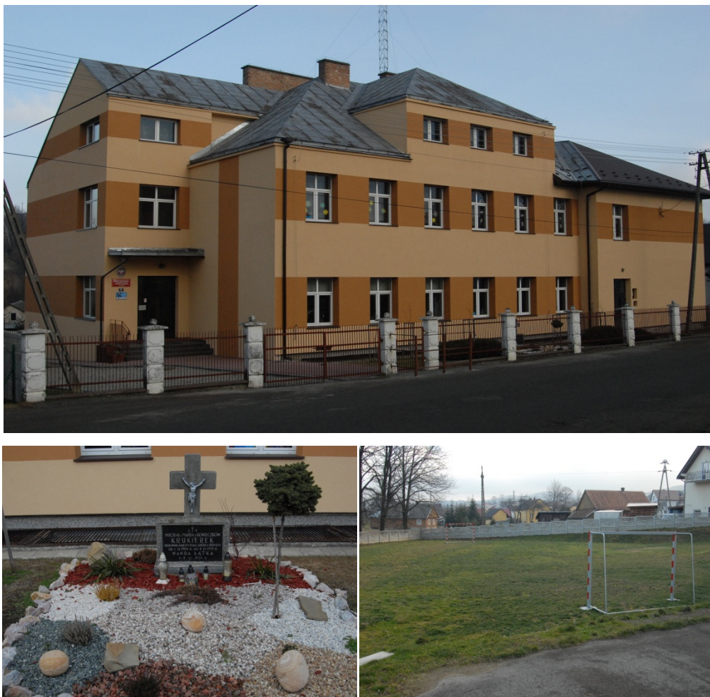
Rys. 10. Zespół Szkół Publicznych im. Marii i Michała Krukierków w Równem

Wieś ze względu na swoją wielkość posiada szkołę podstawową i gimnazjum do której uczęszcza ok. 200 dzieci i która jest bardzo ważnym miejscem dla społeczności lokalnej. Priorytetowym zadaniem dla społeczności jest budowa hali sportowej przy Zespole Szkół Publicznych w Równem.