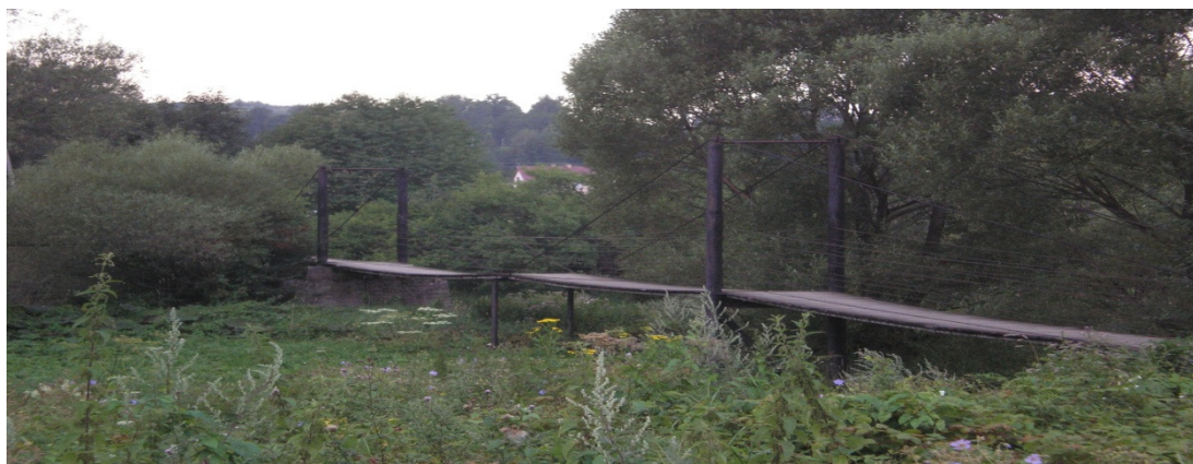
Rys. 6. Ława na rzece „Jasiołka” w miejscowości Równe