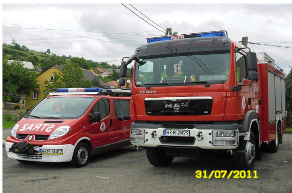
Rys. 8. Sprzęt pożarniczy na wyposażeniu jednostki OSP Równe

Ochotnicza Straż Pożarna w Równem powstała w 1912 roku. W chwili obecnej OSP Równe liczy 54 członków czynnych, 11 członków honorowych i 20 w Młodzieżowa Drużyna Pożarnicza. Jednostka włączona jest do Krajowego Systemu Ratowniczo-Gaśniczego, którego celem jest zwalczanie pożarów, klęsk żywiołowych lub innych miejscowych zagrożeń. W maju 2012 roku jednostka obchodziła uroczyste jubileusz stulecia istnienia.