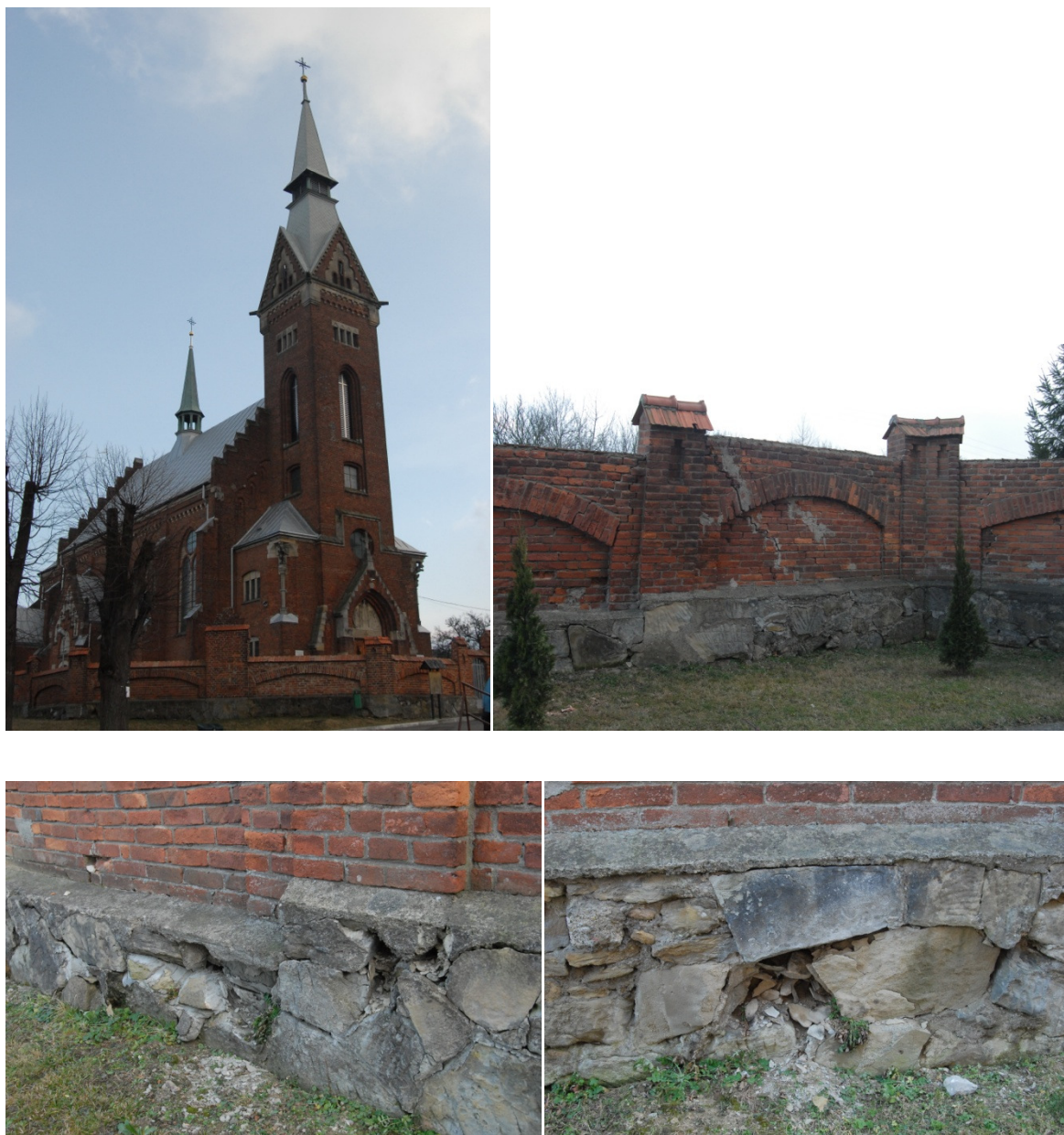
Rys. 12. Kościół parafialny z fragmentami otoczonego rozwalającego się muru

Wieś Równe posiada także zabytkowy kościół, który wymaga modernizacji muru, odnowienia elewacji zewnętrznej czy remontu wieży kościelnej.