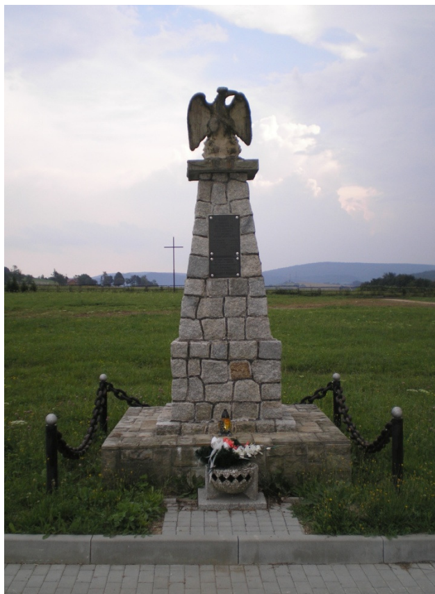
Rys. 2. Pomnik mieszkańców zamordowanych przez Niemców w lipcu 1944 roku na cmentarzu parafialnym w Równem.