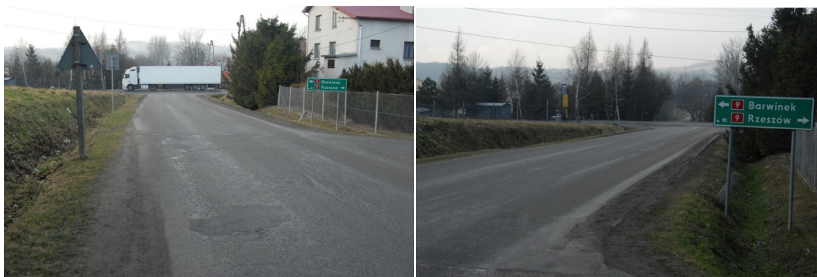
Rys. 4. Droga powiatowa 2000R Równe-Lubatówka.

Dalej ciąg komunikacyjny miejscowości Równe biegnie drogą powiatową Nr 2000R w kierunku Równe – Lubatówka oraz połączoną z nią biegnącą równolegle drogą gminną ulicy Zenona Staronia a także drogą powiatową Nr 1956R-Równe (kopalnia).