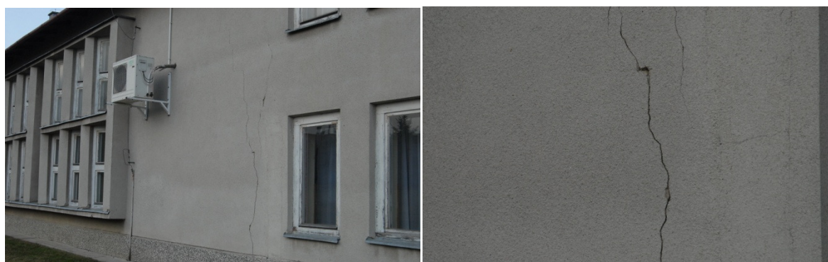
Rys. 11. Budynek Domu Ludowego w Równem