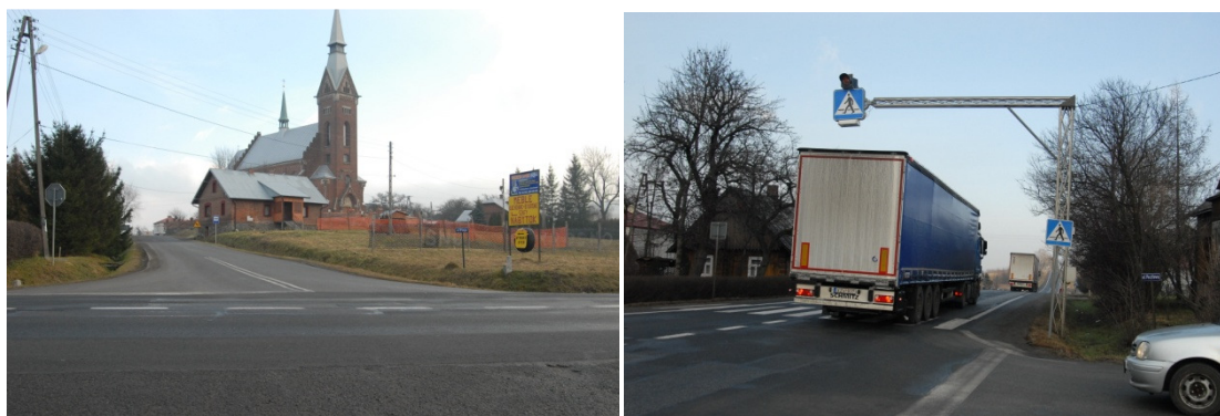
Rys. 5. Droga krajowa Nr 9 w rejonie skrzyżowania z drogą powiatową 2000R Równe-Lubatówka.

Ze względu na szereg wypadków śmiertelnych z udziałem pieszych na drodze krajowej Nr 9, jak również na miejsce usytuowania we wsi szkoły, kościoła i domu ludowego przy drodze powiatowej Nr 2000R budowa chodników przy tych drogach i ich modernizacja jest najpilniejsza w celu poprawy bezpieczeństwa użytkowników.