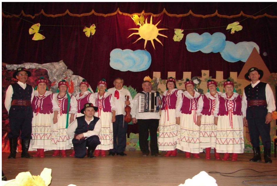
Rys. 9. Teatralno-wokalny zespół artystyczny „RÓWNIANIE”

Zespół „Równianie” powstał w październiku 2000 roku z inicjatywy Koła Gospodyń Wiejskich. W swoich przedstawieniach pokazują regionalne zwyczaje i obrzędy. Celem zespołu jest pielęgnowanie tradycji naszych ojców a także branie z nich wzorców.