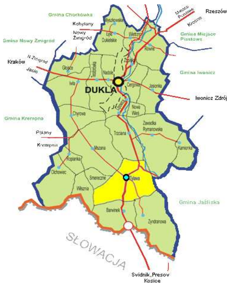
Położenie miejscowości Tylawa w Gminie Dukla (mapa schematyczna).

Poniższa mapa ukazuje Tylawę na tle Gminy Dukla i sąsiednich miejscowości.